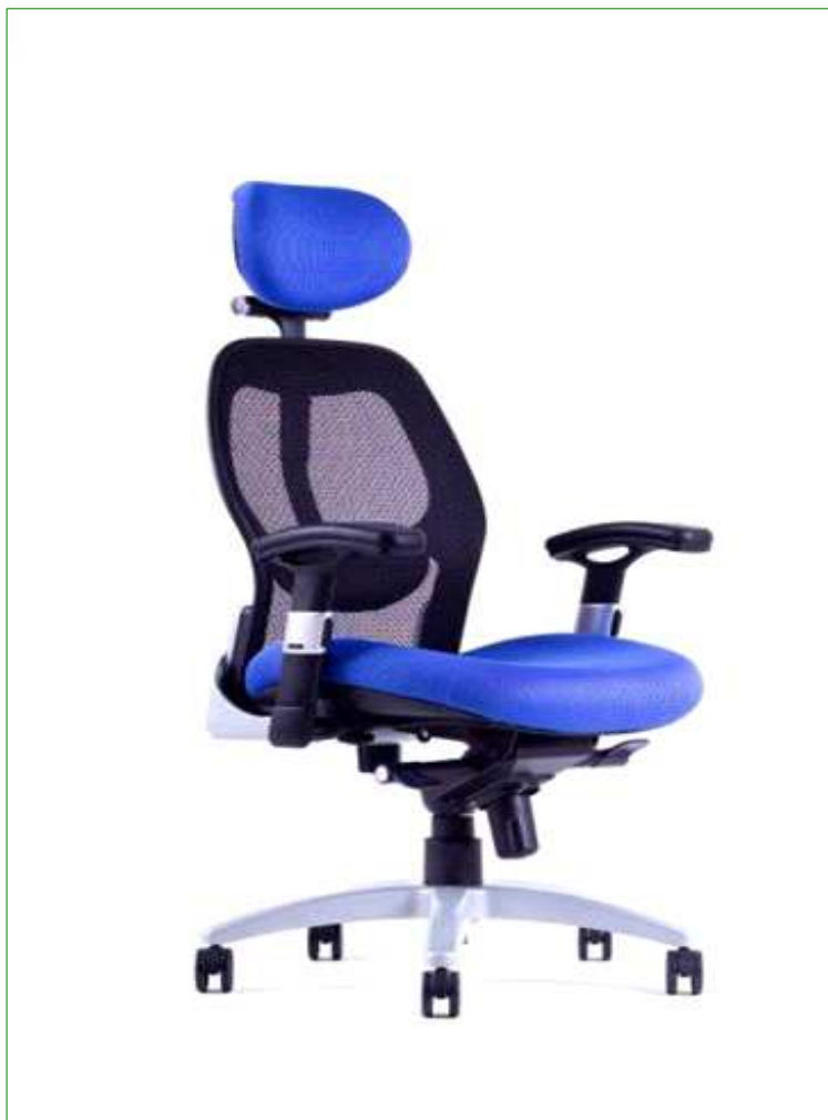
N17 - kancelarska židle pro zaměstnance

Kancelářská židle - manažerské křeslo ergonomické, se stavitelnými područkami a s plynovým pístem, nosnost do 130ti kg. - celokovová synchronní mechanika. - výškově stavitelné područky. - výškově a hloubkově stavitelná bederní opěrka. - výškově a kloubově stavitelný podhlavník. - samonosná síťovina na opěráku. - masivní kovový kříž. - záruka 36 měsíců.